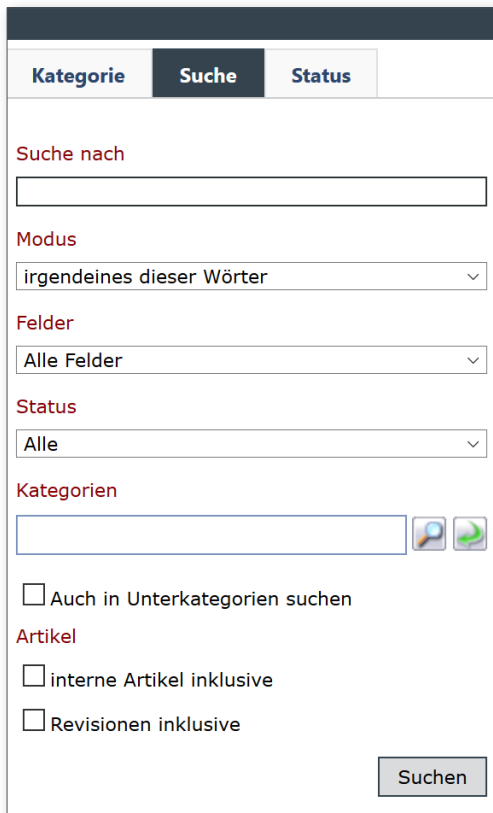
SUCHFUNKTIONEN Suche nach Freitext und Kriterien